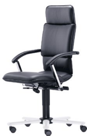
T-C8-A-D1-S aktywne podparcie miednicy regulowana wysokość podłokietników podparcie ramion LW stal, aluminium, kolor biały

Jeśli chodzi o obrotowe krzesła biurowe rodzina siedzisk Collection C jest najlepsza w swojej klasie. Projekt tej serii cechuje się stabilnością. Najlepsze materiały i najwyższej jakości wykonanie sprawiają, że krzesła te są idealnym rozwiązaniem dla kadry zarządzającej. Collection C zapewnia pierwszorzędny komfort siedzenia, dzięki funkcji aktywnego podparcia miednicy. Design: Arno Votteler.