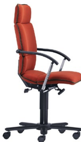
T-C8-A-D1-S aktywne podparcie miednicy regulowana wysokość podłokietników podparcie ramion LS stal, kolor czarny