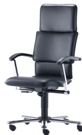
T-C10-A-D1-S aktywne podparcie miednicy regulowana wysokość podłokietników podparcie ramion GV stal chromowana