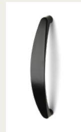
NR 9 Metalowy uchwyt. Srebrny, biały, czarny lub chromowany.