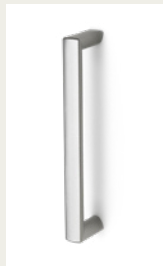
NR 6 Uchwyt z tworzywa sztucznego. Srebrny, biały lub czarny.