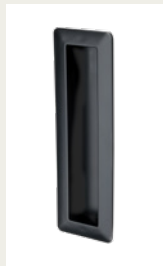
NR 4 Uchwyt wpuszczany z tworzywa sztucznego. Srebrny, biały lub czarny.