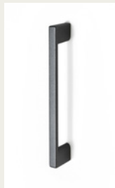
NR 7 Metalowy uchwyt. Srebrny, biały, czarny lub chromowany.