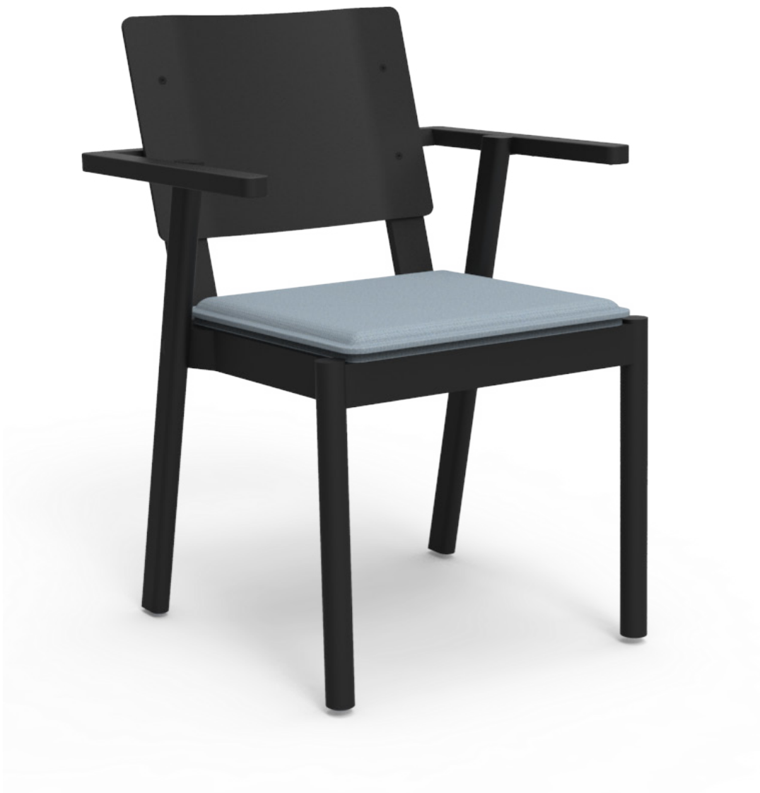
JACKIE DESIGN: PETER ANDERSSON