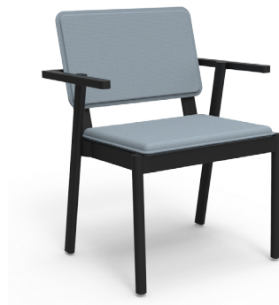
JACKIE 1132 XL